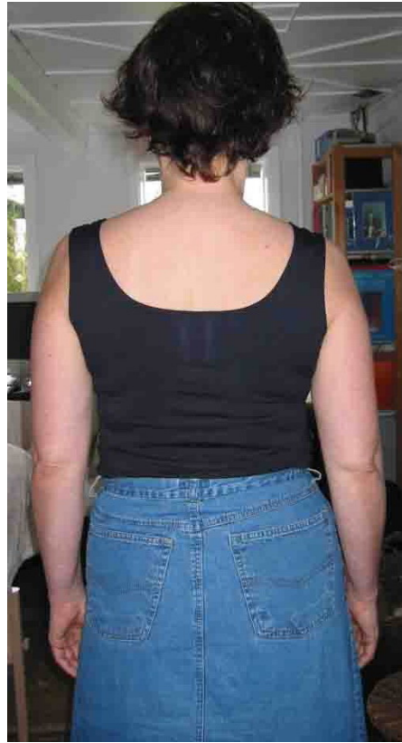
Schulterblätterunterschied ausgeglichen Beinlängenunterschied ausgeglichen