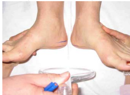
Wir können sehen, dass die Wirbelsäule sich aufgerichtet hat, das Becken korrigiert und der Unterschied der Beinlängen ausgeglichen worden ist.