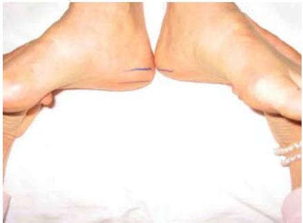
Auf Grund der Schiefe der Wirbelsäule und des Beckens sehen wir, dass die Beinlängen verschieden sind, wenn man diese im Sitzen mit ausgestreckten Beinen misst.