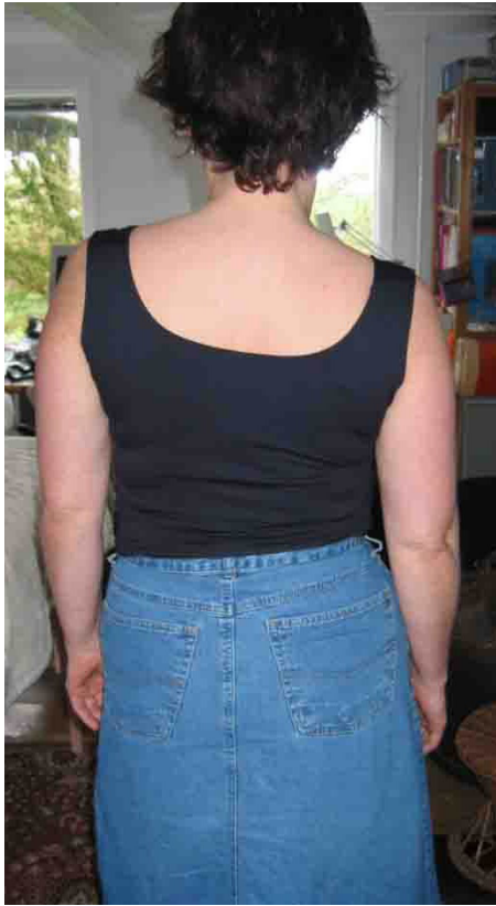
Schulterblätterunterschied ca 1 1/2 cm Beinlängenunterschied ca 1 cm